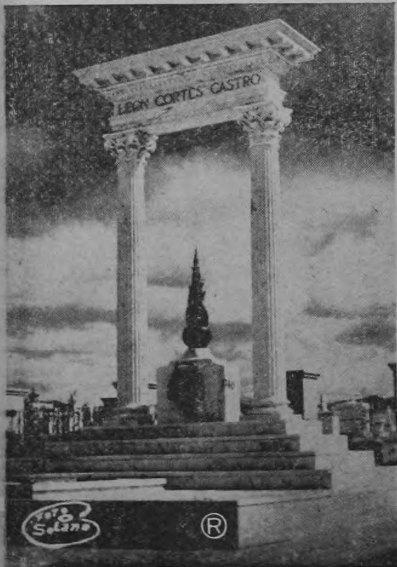
MAUSOLEO A DON LEON CORTES. —El domingo 27 del corriente mes, a las 8 y media de la mañana, tendrá lugar el traslado de los restos del ex-Presidente Leon Cortés Castro, al nuevo Mausoleo que aparece en la gráfica. Dicho mausoleo fue erigido por contribución pública de todos los costarricenses que siempre vieron en el Caucho León Cortés, al apóstol del sufragio costarricense y a uno de sus más destacados hombres de estado.

Cabe agregar que el vehículo circulaba a tal exceso de velocidad que al frenar dejó una marca de aproximadamente ochenta pies de largo.