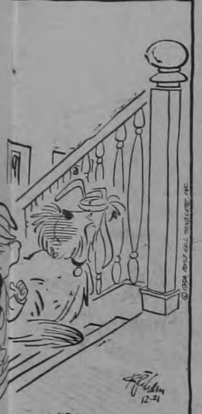
¿... se felicitan por el año que esté durmiendo?