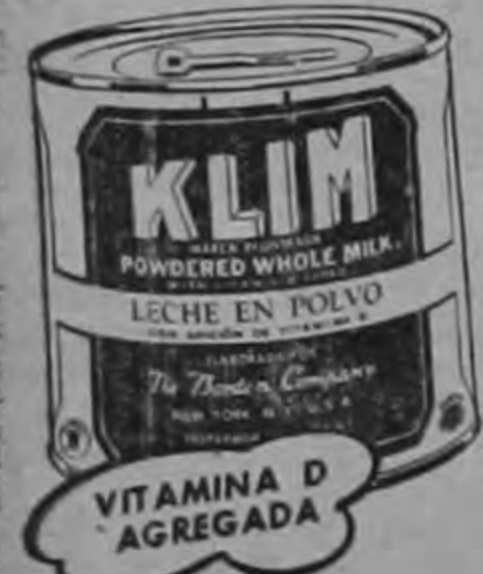
LA MEJOR LECHE

Los médicos recomiendan la pura y sana leche Klim. Es una saludable y cremosa leche de vaca en forma conveniente de polvo. Es MAS FACIL de digerir... es la MEJOR leche para su bebé.