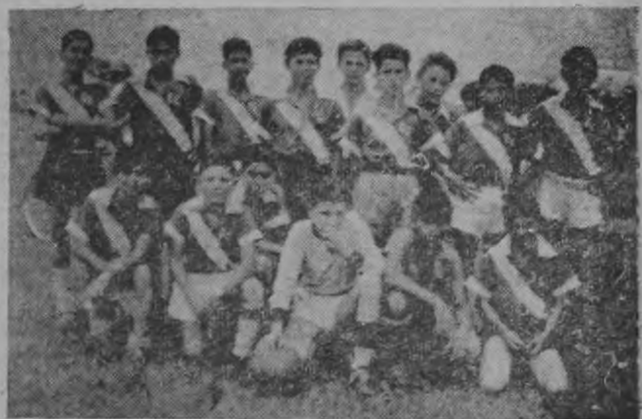
EQUIPOS DE LA LIGA MENOR DE FUTBOL.—Atlético Carif Infantil uno de los más modestos cuadros de La Liga Menor de Fútbol, en ellos está representado el verdadero deportivismo, ya que sus actuaciones lo ameritan como el equipo más disciplinado.